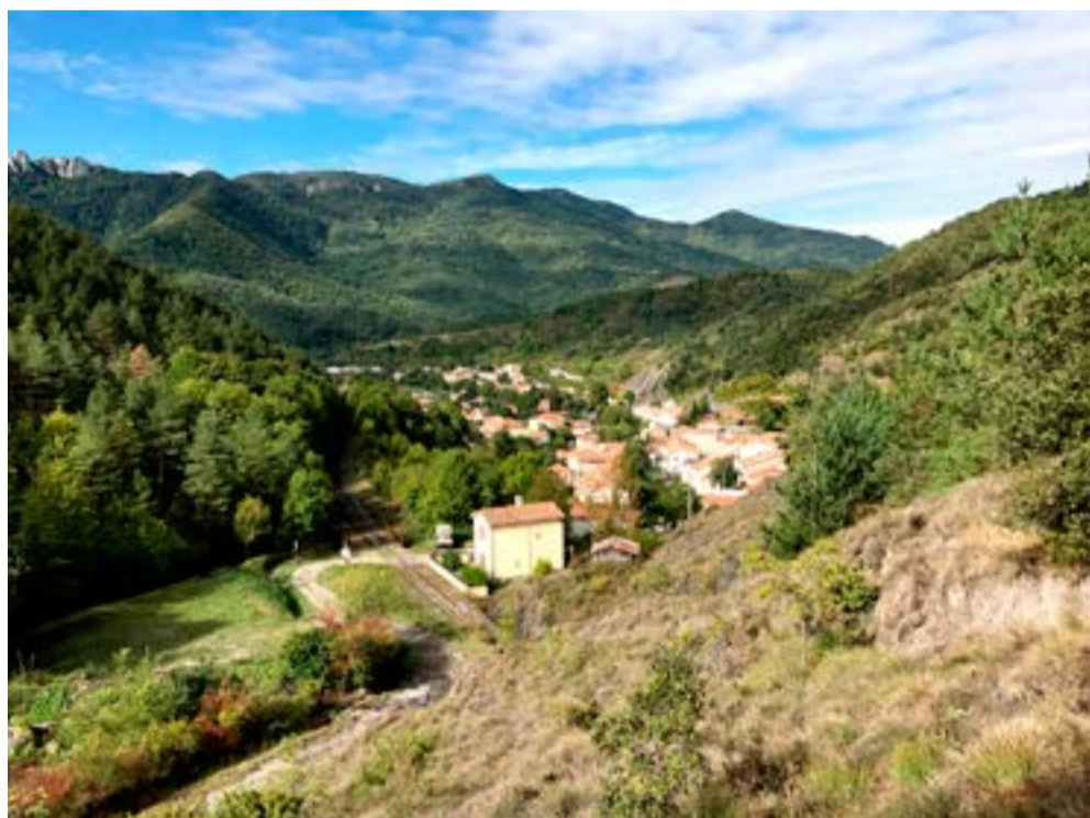
Rejsen går til den sydfranske landsby Axat for foden af Pyrenæerne.